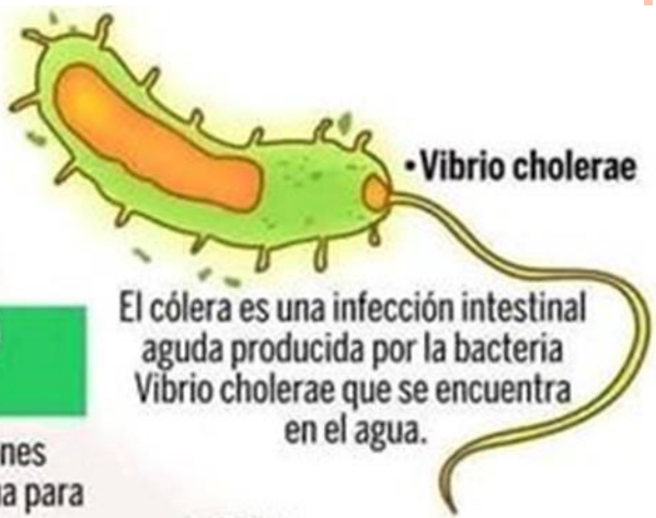
• Vibrio cholerae

El cólera es una infección intestinal aguda producida por la bacteria Vibrio cholerae que se encuentra en el agua.